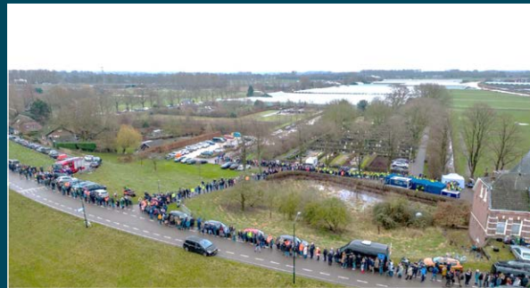
Vele vrijwilligers tijdens een zoekactie in Sleeuwijk.

Op een zondagmiddag in april 2016 werd op Urk via Facebook een eenvoudige maar betekenisvolle oproep gedaan: "Er is een jongen vermist, wie helpt mee zoeken?" Binnen korte tijd meldden zich vijfhonderd vrijwilligers en werd het hele dorp in enkele uren doorzocht. De coördinatie lag in handen van de mensen die inmiddels al tien jaar de kern van stichting CPV vormen. Zij weten als geen ander hoe groot de impact en onzekerheid is wanneer een dierbare - en in het bijzonder een kind - vermist raakt en zetten daarom alles in het werk om de vermiste terug te brengen.